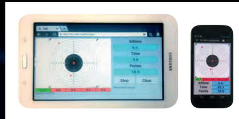
PreciShot-Software für Tablet und Smartphone.