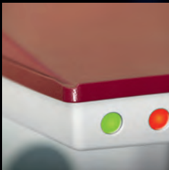
Sonnen- und Regenschutz-System.