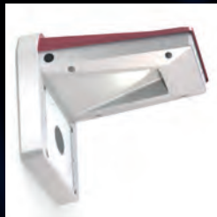
Beleuchtung für Nacht-Wettkämpfe.